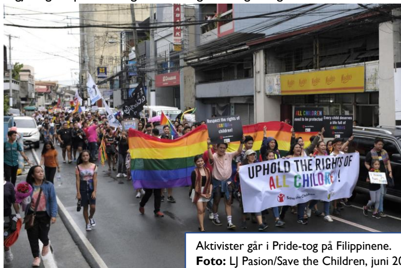
Aktivister går i Pride-tog på Filippinene.

Ved at støtten til sivilsamfunn holdes på 2022-nivå, legges det opp til en reell nedgang. Dette er uforståelig gitt regjeringens prioritering av ulikhet globalt og viktigheten av sivilt samfunn i kampen mot ulikhet. Spesielt viktig er lokale sivilsamfunnsaktører som jobber for demokratiske rettigheter, åpenhet om offentlige budsjetter, og som kjemper mot korrupsjon og ulovlig kapitalflukt. Nedgang i støtten til sivilsamfunnsaktører vil kunne bidra til destabilisering i sårbare områder. Denne støtten er også spredt blant mange ulike, og små aktører. Finansieringen av disse er sårbar, og vi frykter for deres eksistens dersom støtte fra Norge ikke styrkes. Vi ber derfor om at den generelle støtten til sivilt samfunn økes med minst 10%.